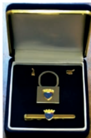
Astuccio con portachiavi e fermacravatta