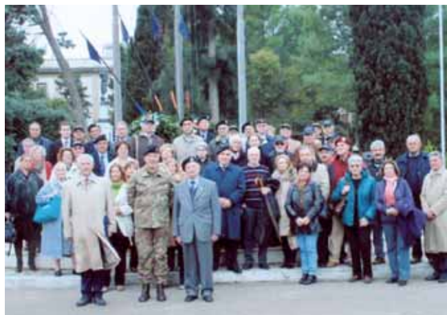
Foto ricordo all'ingresso della Scuola

Un folto gruppo di Ufficiali e rispettivi familiari della Sezione di Taranto ha visitato la Scuola di Cavalleria di