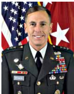
David Howell Petraeus

Come noto, le FF.AA. USA in Iraq erano da quattro anni invischiate in una guerra senza via d'uscita. Ma nel 2007 è subentrata una nuova strategia che ha modificato la situazione. Questo perché è sopraggiunto un nuovo modo di affrontare il conflitto: si tratta appunto della strategia del Gen. Petraeus, che è riuscito a convincere i vertici politici alla sua adozione ed è divenuto il Comandante delle forze.