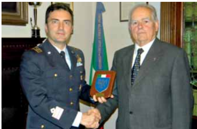
La consegna del crest al Col. Cianfanelli

Il Col. Pilota Paolo Cianfanelli, Comandante del 5° Stormo di Cervia dell'Aeronautica Militare - uno dei reparti che attualmente assicurano la sorveglianza aerea e la sicurezza dei cieli italiani - ha visitato la sede della sezione UNUCI di Cesena, comune nel quale è situata la zona logistica dello Stormo.