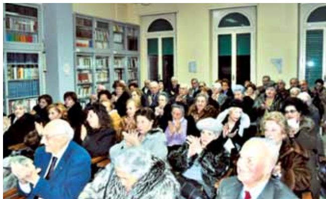
Il pubblico presente alla cerimonia