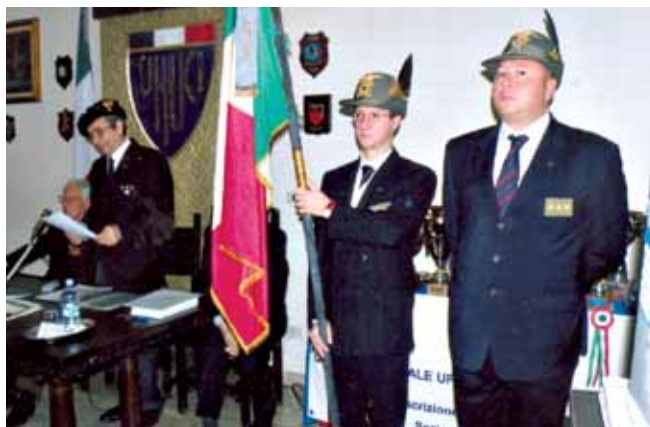
Un momento dell'incontro

Nell'occasione è stata celebrata una Messa, officiata dal Cappellano Militare della Legione Carabinieri Marche, in suffragio dei Caduti nelle Missioni Internazionali e dei Soci scomparsi.