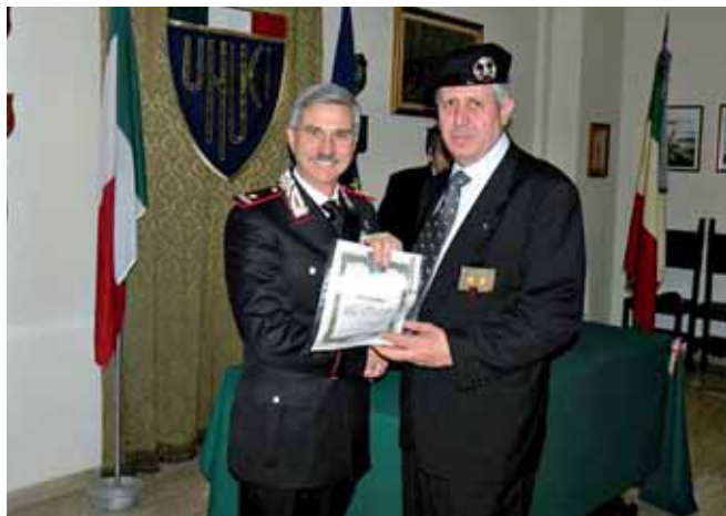
La consegna degli Attestati

Il 19 dicembre 2009, presso la Sede Regionale dell'Unione Nazionale degli Ufficiali in Congedo d'Italia di Ancona, ha avuto luogo l'annuale raduno, alla presenza delle massime Autorità militari della Regione.