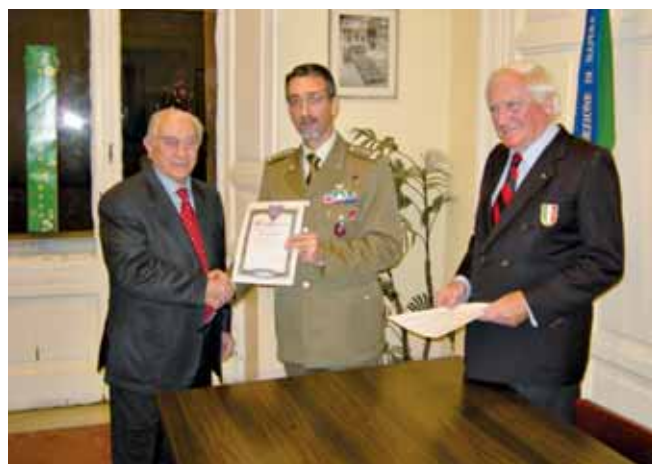
Un momento importante della cerimonia

Il 17 dicembre 2009 si è svolta nella sede della Sezione una significativa cerimonia di consegna degli Attestati di benemerita a Soci che hanno superato i 70, 60, 50 anni di iscrizione all'UNUCI.