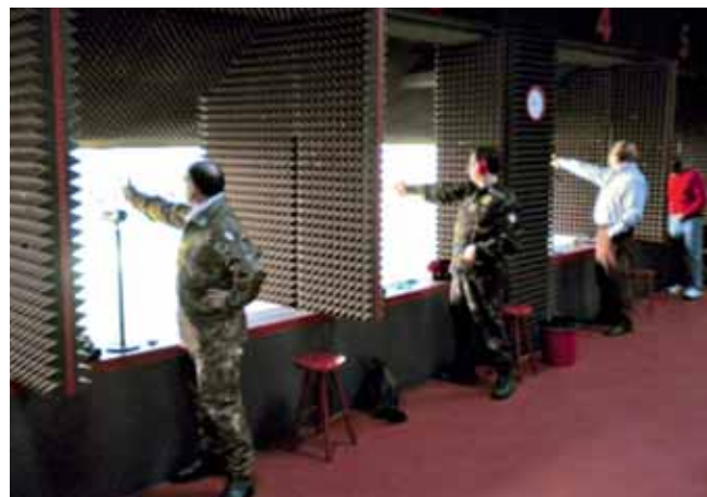
Una fase della gara di tiro

La Circostrizione della Sicilia ha organizzato e svolto una gara regionale di tiro con pistola cal. 22 lr. per determinare la squadra dell'UNUCI Sicilia che parteciperà nel 2010 alle competizioni nazionali.