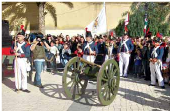
Uno scorcio della cerimonia

trattato di un evento di ricostruzione storica ripreso dalle televisioni e dai giornali di tutto il mondo. Il gruppo di ricostruzione storica "Reggimento Real Marina" di Unuci Caltanissetta ha partecipato alla cerimonia di ufficializzazione del decreto del Presidente della Repubblica, Giorgio Napolitano, che ha elevato il comune di Porto Empedocle al rango di "Città" e ha aperto la parata storica con le proprie uniformi, i fucili e il cannone, repliche fedeli delle armi del tempo.