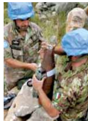
Militari italiani impegnati nella bonifica di una bomba inesplosa

Esistono anche team specializzati nell'ambito della bonifica delle aree in cui sono presenti ordigni inesplosi. Un compito quanto mai arduo: secondo i dati diffusi dalle Nazioni Unite, infatti, dalla fine della “Guerra d'estate” del 2006, la superficie del territorio disseminata di ordigni inesplosi di varia natura è stata stimata in circa 37,5 milioni di metri quadrati. Proprio su queste aree i team per la bonifica di ordigni esplosivi E.O.D. ( Explosive Ordinance Disposal ), e quelli specializzati nella per la bonifica di ordigni esplosivi improvvisati I.E.D.D. ( Improvised Explosive Device Disposal ), di concerto con le unità cinofile per la ricerca di esplosivi e mine, sino a oggi, sono riusciti ad individuare e far brillare oltre 3.150 ordigni, tra i quali oltre 2.900 cluster bombs , circa 170 tra razzi e proiettili da mortaio, e oltre 70 ordigni di varia natura. Attualmente, la superficie bonificata delle aree minate supera i 23.000 chilometri quadrati.