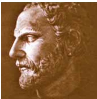
Il poeta Tirteo

Secondo la tradizione di Giustino l'oracolo di Delfi aveva co-