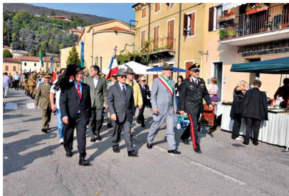
Sfilata per le vie cittadine a conclusione della manifestazione

identificazione mezzi ed obiettivi, liberazione ostaggio, operatività in ambiente contaminato da agenti NBCR, primo soccorso, identificazione ed ingaggio mezzi corazzati. La fase operativa dell'esercitazione si è conclusa nel tardo pomeriggio in Grezzana dove, il giorno successivo, si è svolta la cerimonia di chiusura e premiazione. Si è registrata una partecipazione numerosa e calorosa da parte della popolazione, che ha seguito con interesse l'evento.