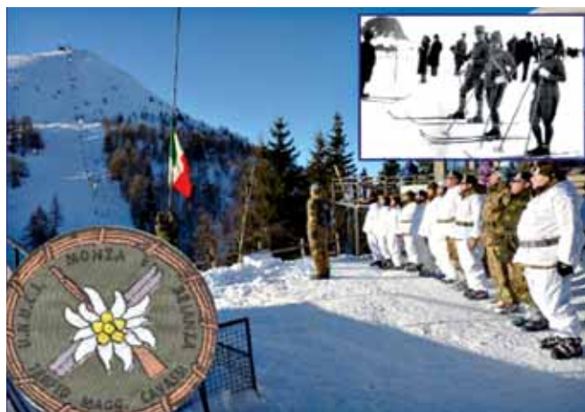
Una immagine significativa dell'evento

Sabato 23 gennaio si è svolta la seconda edizione del Trofeo intitolato al Maggiore MAVM Italo Cavassi, biathlon invernale di sci, slalom gigante, e tiro con carabina per militari della riserva, per volontari della protezione civile, della CRI e per gli studenti delle scuole secondarie superiori che partecipano al progetto Allenati per la vita .