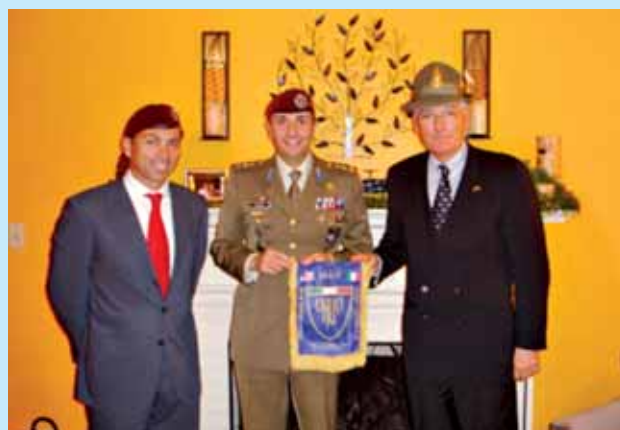
Un momento della visita

Il 26 gennaio scorso diversi Ufficiali hanno potuto visitare Ft. Benning-GA, sede delle varie Brigate di Addestramento per truppe aeroportate e della Divisione di Cavalleria Eliportata dell'US Army.