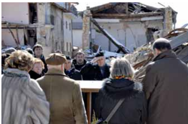
Il gruppo di Avezzano a L'Aquila

La Sezione, insieme ad associazioni combattentistiche e d'Arma, mercoledì 13 gennaio 2010 ha partecipato alla cerimonia del 95° anniversario del terremoto. Al termine, la deposizione di una corona di alloro al "Memorial". Successivamente, il 27 gennaio, ha partecipato alla "Giornata della Memoria" nelle Scuole Medie "Alessandro Vivienza" e "Luigi Marini" di Avezzano. Hanno presenziato alla cerimonia le rappresentanze delle Associazioni combattentistiche e d'Arma.