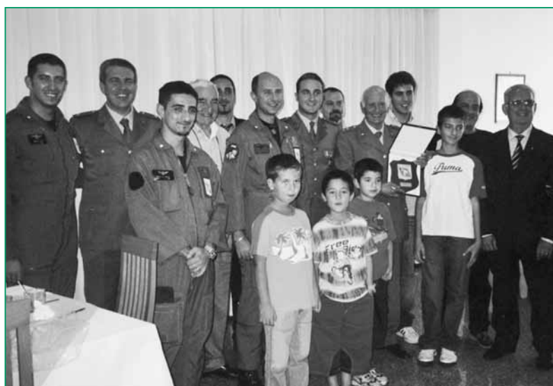
UNUCI S. Agata Militello - Visita al 37° Stm. a Trapani-Birgi.

Annecy (Francia) e di Bayreuth (Germania). Annecy è gemellata con la città di Vicenza, mentre gli Ufficiali della Riserva di Bayreuth saranno gemellati, il prossimo anno, con gli Ufficiali in Congedo di Vicenza.