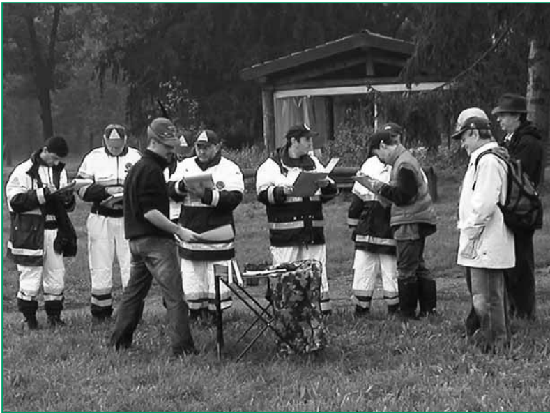
UNUCI Monza e Brianza - Corso di topografia ed orientamento per volontari della Protezione Civile.