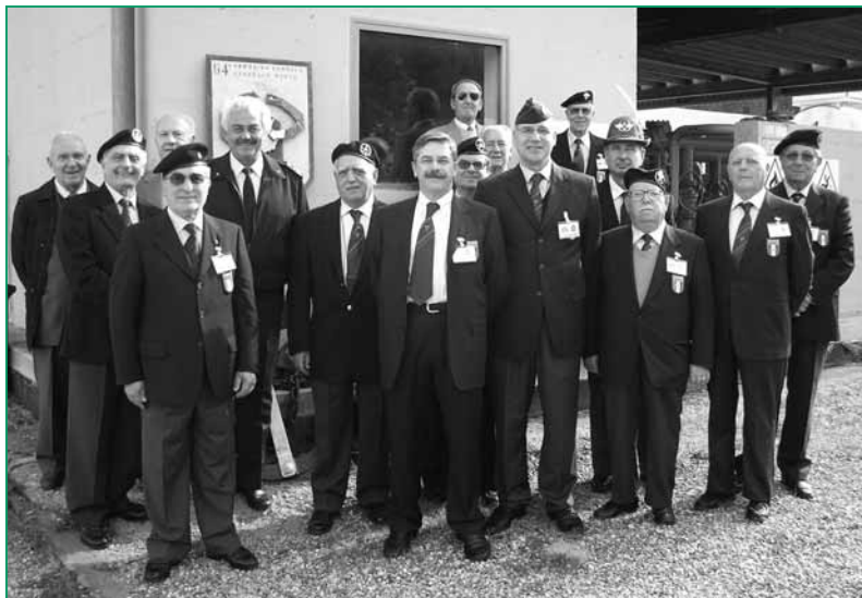
UNUCI Grosseto - Visita al 64° Deposito Territoriale A.M. a Porto Santo Stefano (GR).