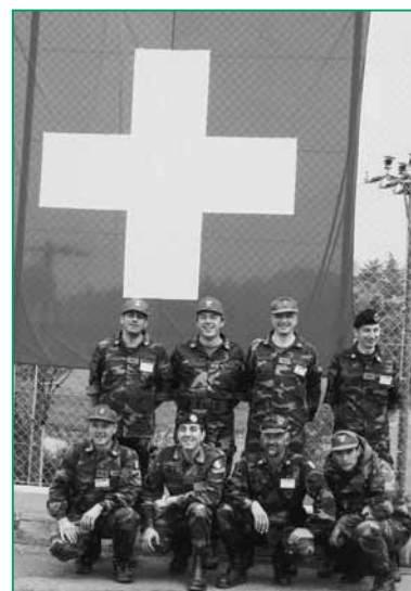
Il Gruppo Sportivo di UNUCI Pordenone.

Nel corso del 2006 il Gruppo Sportivo della Sezione di Pordenone si è distinto partecipando a varie gare internazionali, come la gara di tiro dinamico svoltasi a Nova Gorica, la TIA 2006 a Bernex, presso Ginevra ed il Trofeo San Martino 2006 orga-