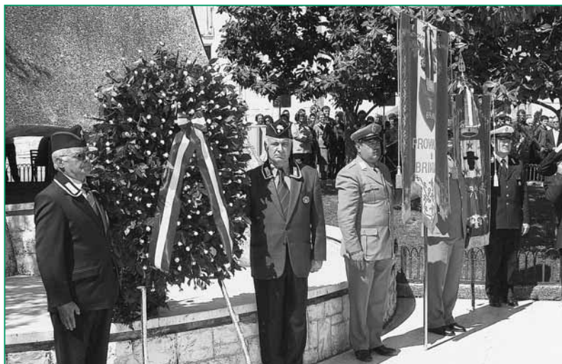
UNUCI Brindisi - Raduno delle Associazioni d'Arma e Combattentistiche in festa per il tricolore: deposizione della Corona d'Alloro al Monumento ai Caduti.