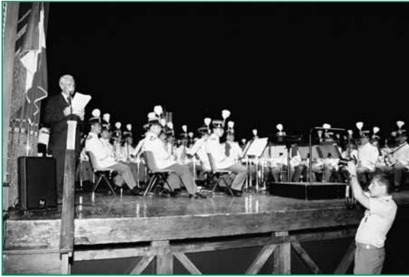
Un momento dell'esibizione della Banda dell'Esercito.

le e con l'appoggio della Brigata Aeromobile "Friuli" di Bologna.