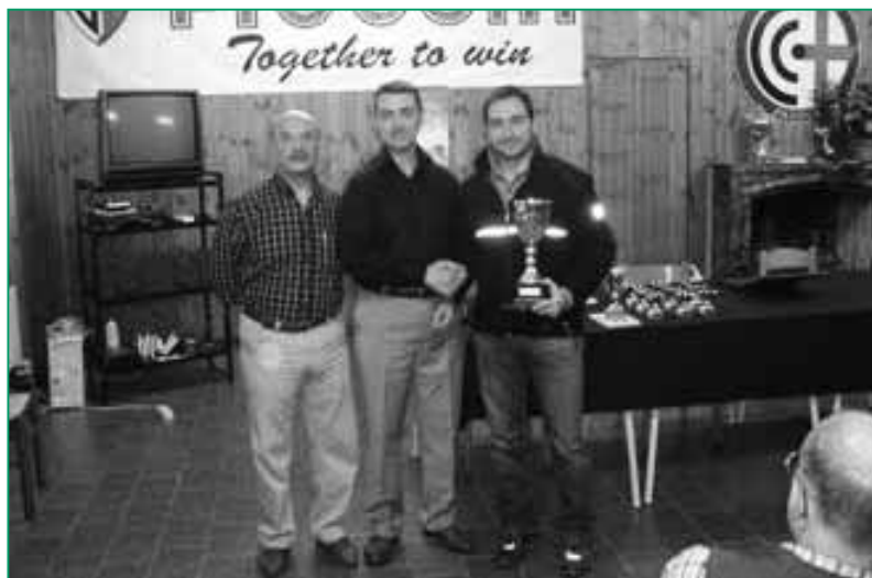
UNUCI Padova - Un momento della premiazione del trofeo "UNUCI Patavium".

delle Valli del Ticino, a Cameri (NO), la 13ª Gara a cavallo "Trofeo