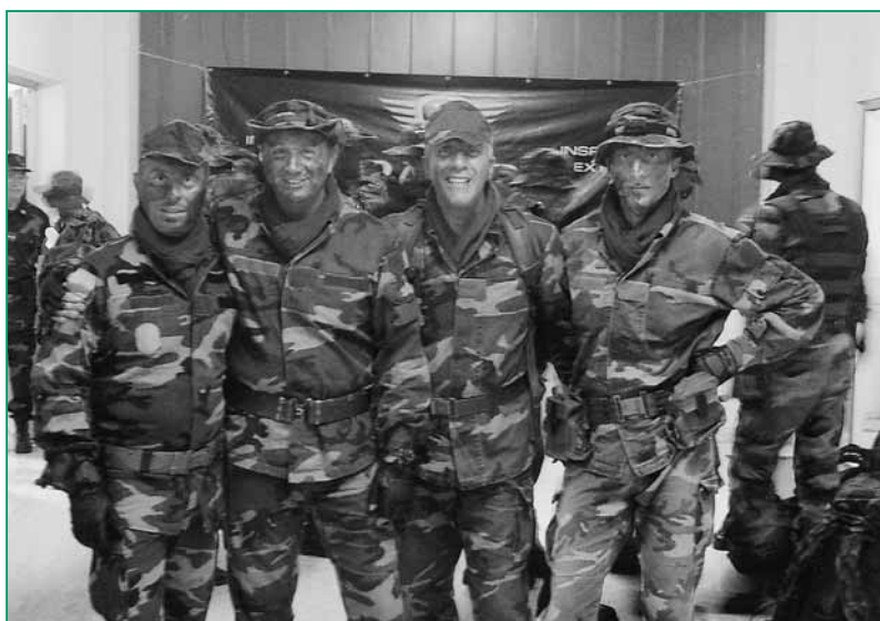
UNUCI Napoli - Dragon Recon 2006: la squadra di UNUCI Perugia, 1 a classificata tra le squadre associative.

Si può orgogliosamente affermare che la Sezione di Napoli ha onorato i principi statutari, riscuotendo stima e considerazione da parte del 2° Comando