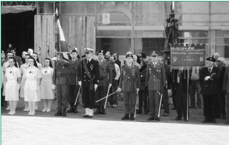
UNUCI Catania - La rappresentanza con Bandiera della Sezione catanese alla cerimonia del 4 Novembre.