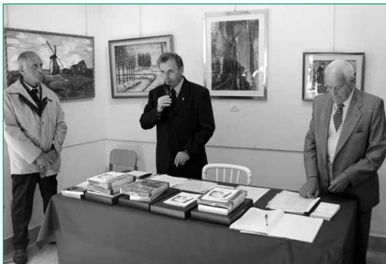
UNUCI Avezzano - Premiazione della 9ª Mostra Interregionale d'Arte.