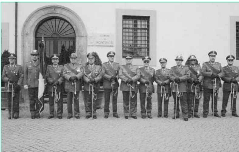
UNUCI Monterosi-Toscia Sud - Celebrazione del 4 Novembre.