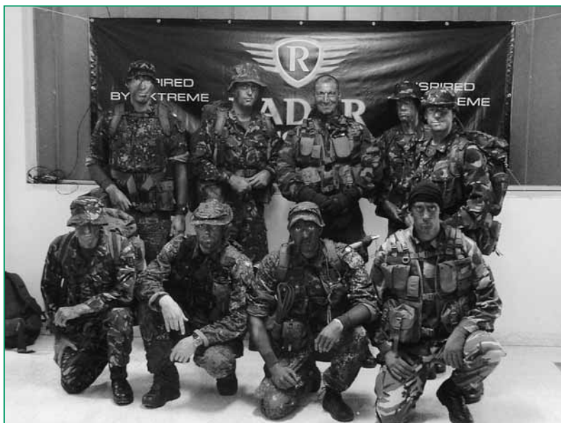
Un gruppo misto di partecipanti: danesi del Light Recon Section 4° class.; 38° Signal rgt. del Regno Unito 3° class.; 1° Rgt. granatieri 3° class.

operare pattuglie associative e militari, italiane e straniere, in una serie di prove impegnative. Due le novità quest'anno; il tempo favorevole, che ha scacciato il ricordo delle intemperie delle scorse tre edizioni e il riconoscimento ufficiale, da parte del 2° Comando delle Forze Operative di Difesa, dell'importanza addestrativa della gara per le proprie unità, che dovranno inviare reparti in missioni all'estero. Infatti è stato chiesto all'UNUCI di Napoli di far partecipare, accanto alle proprie, il maggior numero di pattuglie dei Reggimenti delle Brigate del 2° FOD, "Granatieri", "Pinerolo", "Garibaldi" e supporti. Solo l'im-