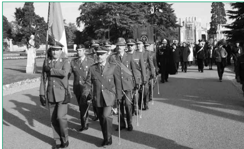
Il Gruppo Bandiera in uniforme della Sezione di Monza e Brianza che ha partecipato alle celebrazioni per il 4 Novembre.

svoltasi alla presenza delle massime Autorità militari, civili e religiose